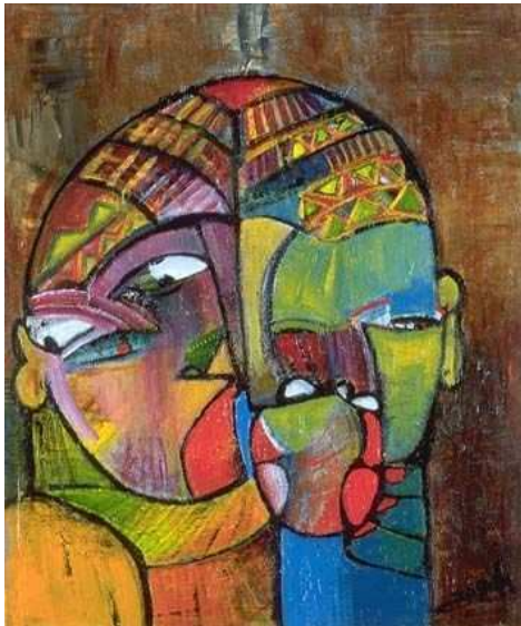
L'incompréhension - de Geoffroy

Bruno de Geoffroy est un peintre cubiste, expressionniste français contemporain qui peint depuis 25 ans avec une vision large d'une pièce de deux euros.