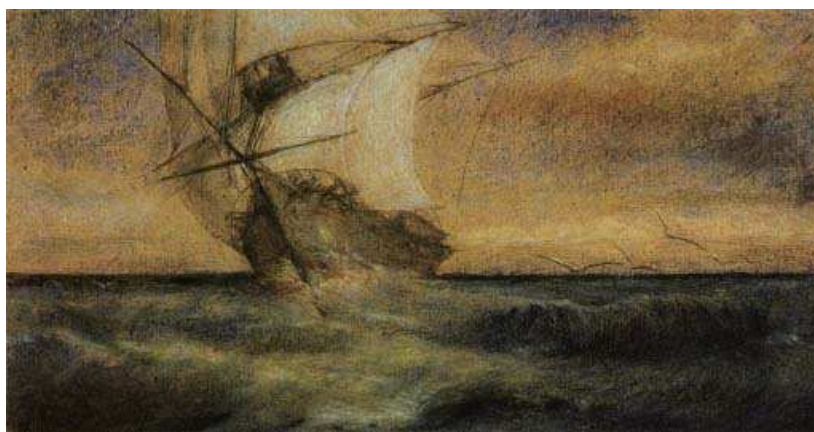
Photographie du tableau « Le bateau fantôme » de Charles Meryon »

Une des rares peintures qui nous reste, au Louvre, s'appelle « Le bateau fantôme » qui est un tableau remarquable car l'artiste a évité les couleurs qui lui donnent le plus de difficultés, les rouges et les verts. Il ne voyait que les teintes réparties en deux groupes, soit dans les bleus, soit dans les jaunes. C'est ce qu'on retrouve sur la peinture.