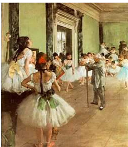
La classe de Danse – Degas (vers 1973)

On résume souvent l'art impressionniste aux effets de lumières en plein air. Ces caractéristiques ne sont toutefois pas applicables à Degas qui a surtout peint des intérieurs. On dit qu'au début, il était gêné par la luminosité excessive du soleil. Vers 50 ans, sa vision baissant encore, il ne percevait que la périphérie de la scène. Il perdit peu à peu la vision colorée.