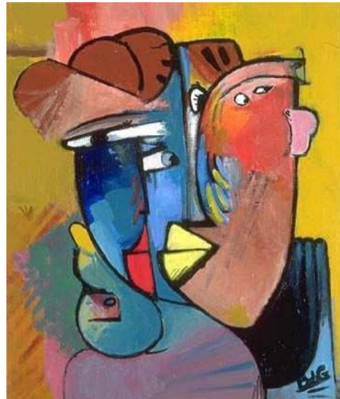
L'attentisme - de Geoffroy