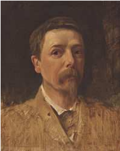
Georges du Maurier, autoportrait (1879)

Son angoisse fut totale lorsqu'il constata que son œil droit était touché à son tour. Il testa la vision de cet œil et s'aperçut qu'il y avait une tache aveugle en s'approchant d'un détail d'un dessin, il ne percevait plus le détail d'à côté ! Il comprit plus tard que cette tache correspondait à la tâche de Mariotte dont il avait pris conscience du fait de sa monophthalmie.